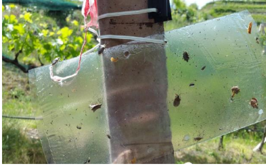
Trappola a pannello innescata con feromone Trecé. Nel vigneto oggetto di indagine ne sono state installate 31