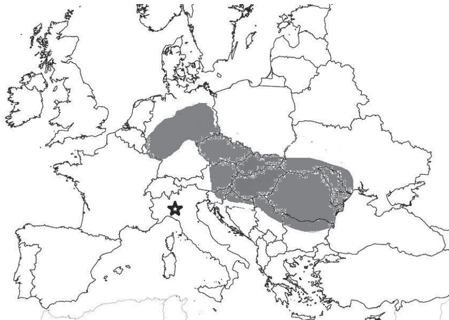
Figura 2 Distribuzione europea di Aradus distinctus Fieber, 1860 (dis. P.Dioli). Con una stella le nuove località italiane in provincia di Pavia.

Desideriamo ringraziare vivamente l'amico e collega Giuseppe Pace per aver messo a disposizione il materiale della sua collezione. Inoltre esprimiamo i sensi della nostra stima al prof. Ernst Heiss di Innsbruck, per averci spronato a intensificare le ricerche sugli Aradidae.